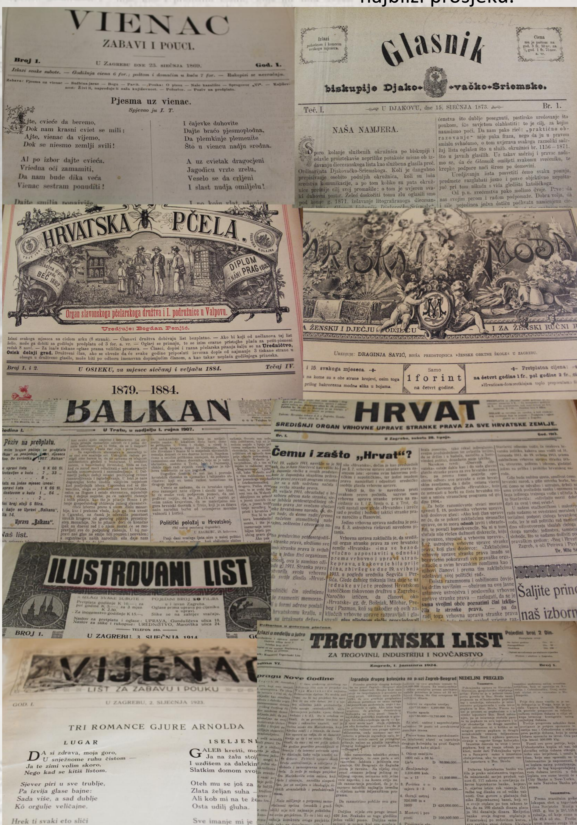
Slika 7: Naslovnice